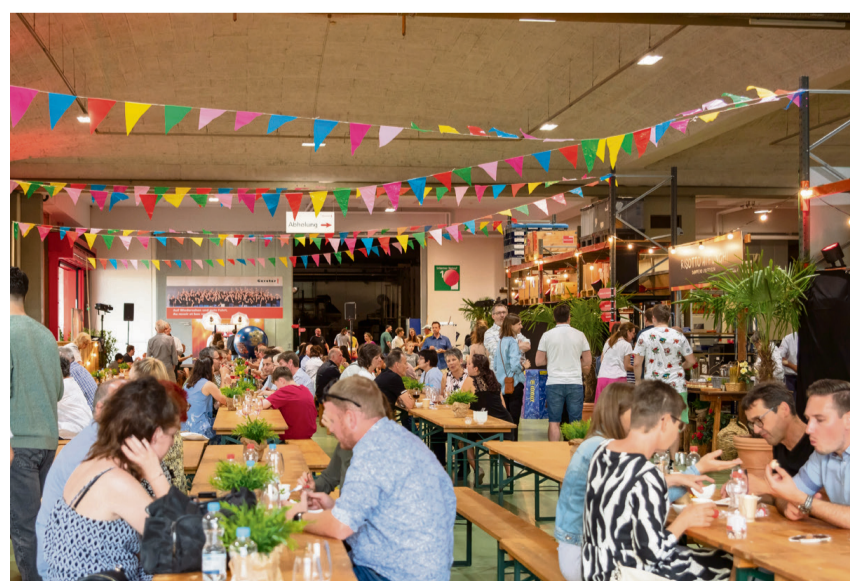
Nach dem Rundgang verpflegten sich die Gäste kostenlos bei einer feinen Auswahl an Gerichten aus der etwas anderen Wärmebehandlung.