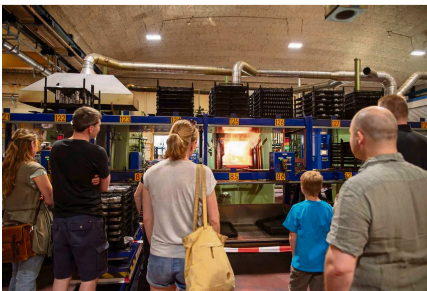
So sehen 900 Grad Celsius aus: Auf dem Rundgang wurden für die Gäste die Türen eines Wärmebehandlungsofens geöffnet, um die Wärme nicht nur sichtbar, sondern auch spürbar zu machen.